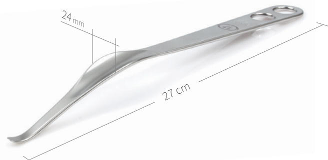
24.51.140 Subtilis juvenil Beckenheber Eva 24 x 45 mm / 27 cm