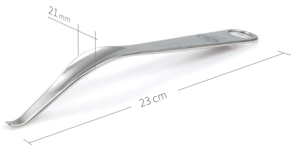
24.51.146 Subtilis juvenil Pubis-Hebel Ganz mit kurzem Schnabel 21 mm / 23 cm