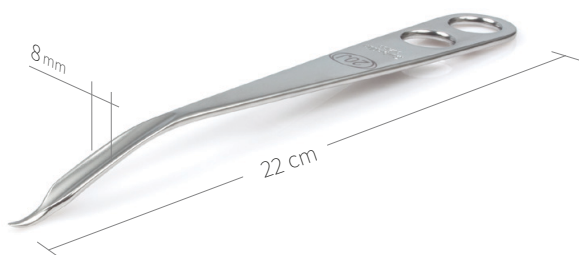
24.51.136 Subtilis juvenil Knochenheber Hohmann spitz 8 mm / 22 cm