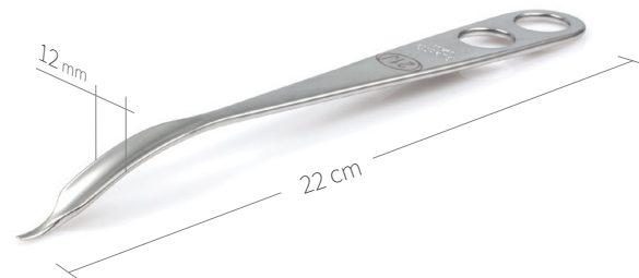
24.51.137 Subtilis juvenil Knochenheber Hohmann spitz 12 mm / 22 cm