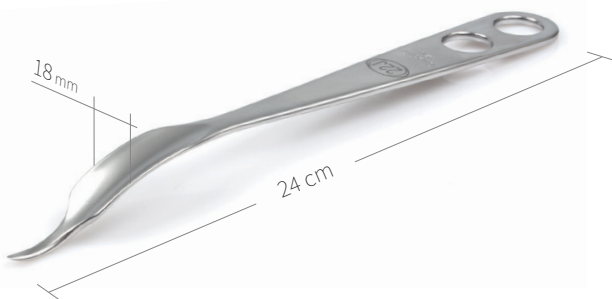
24.51.138 Subtilis juvenil Knochenheber Hohmann spitz 18 x 37 mm / 24 cm